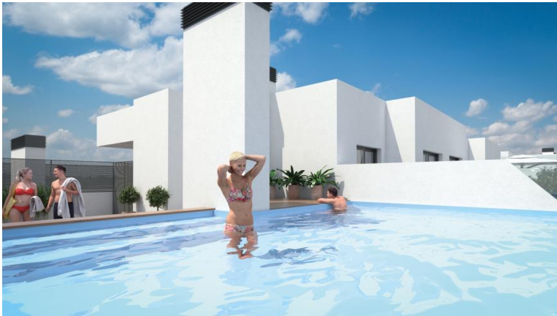
Piscina comunitaria en planta ático.