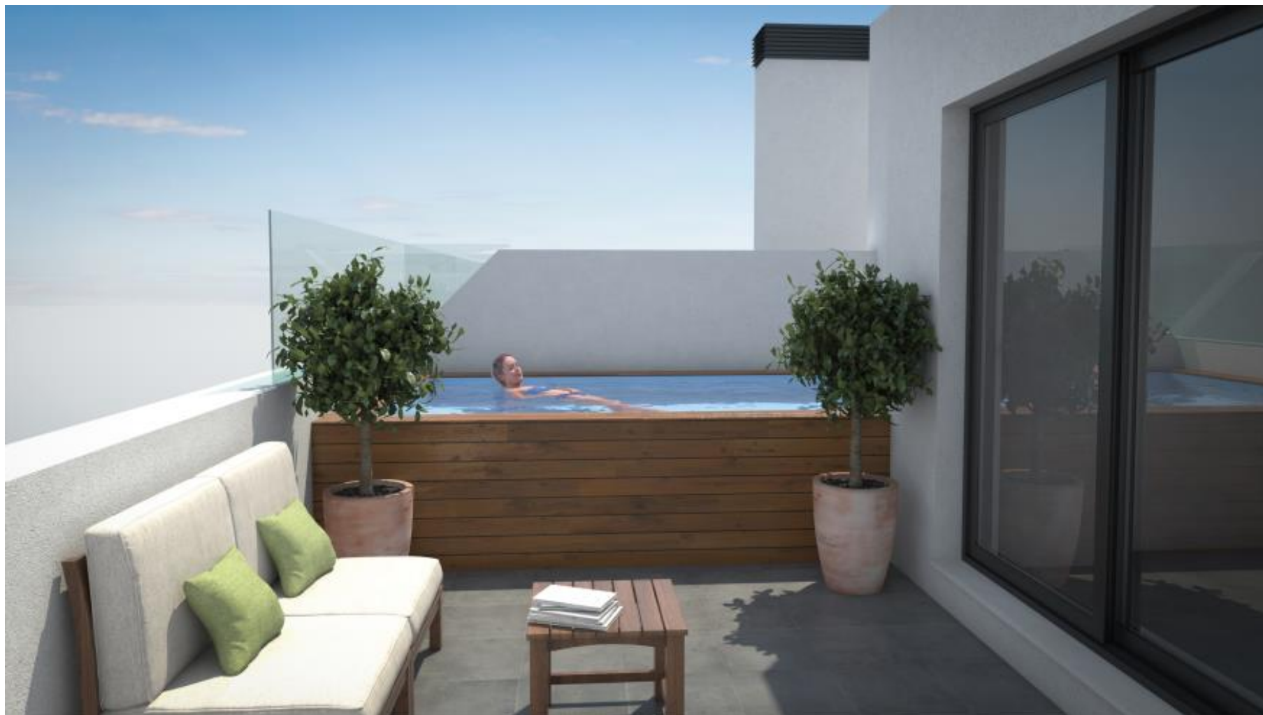
Piscina privada en viviendas con terrazas (OPCIONAL).