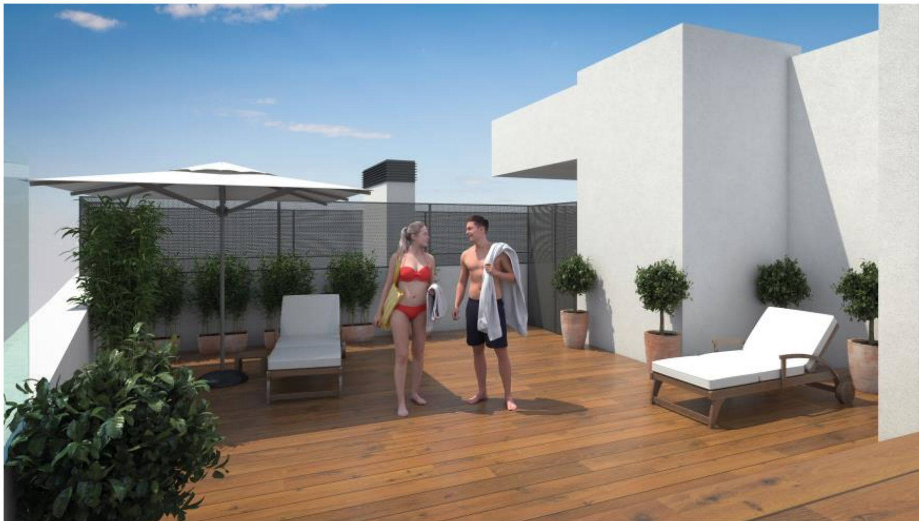
Solárium en planta ático.